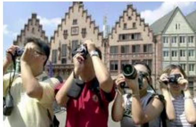
Seit Februar 2003 kommen Pauschaltouristen aus China

Manchmal ist das Verhalten der Besucher aus dem Reich der Mitte für Deutsche gewöhnungsbedürftig – doch Besserung ist in Sicht. In chinesischen Reiseführern werden Europafahrer neuerdings ermahnt, nicht so lautstark zu palavern, das Spucken auf den Boden sowie das Rülpsen im Restaurant zu unterlassen. Auch sei es im Westen „nicht üblich, im Schlafanzug auf die Straße zu gehen“.